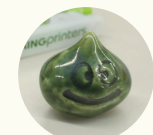
記念すべき第一作はスライムくん。